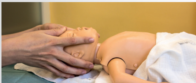
Správná poloha hlavy