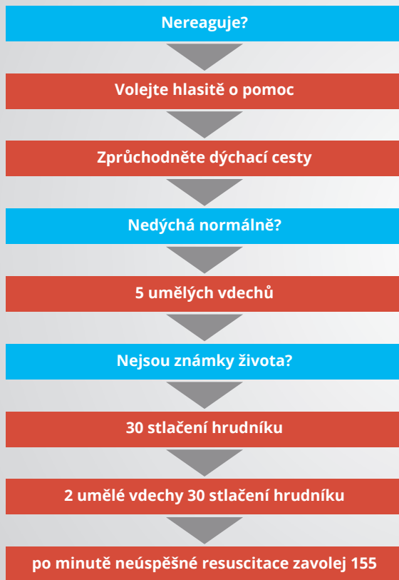
Schéma resuscitace pro nezdravotníky – dle ERC Guidelines 2010